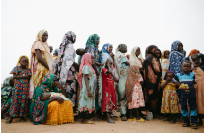
Ilustración 2: Abigajla Conway/World Vision (2024).

El reconocimiento oficial de estas prácticas como violaciones a los derechos humanos comenzó a consolidarse a partir de la década de los 1990's, cuando los tribunales internacionales y la ONU empezaron a documentar la violencia sexual ritualizada no como "costumbre cultural", si no como una forma de violencia de género hacia las mujeres. En el Tribunal Penal Internacional para Ruanda, en 1998, se reconoció la violencia