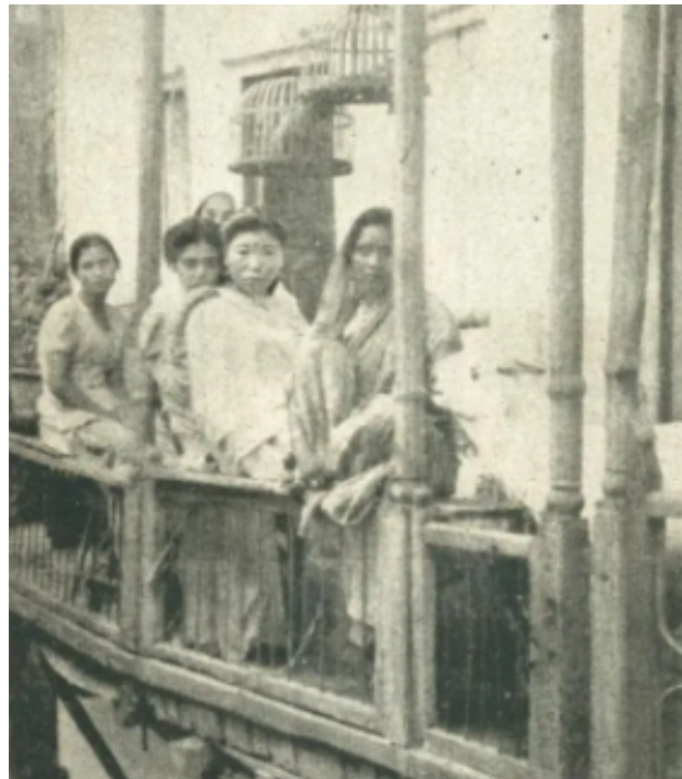
Ilustración 2: La mujer que luchó por su derecho a ser prostituta.

Con el surgimiento de los movimientos feministas y de derechos humanos en el siglo XX, esta visión comenzó a ser cuestionada globalmente. El debate se convirtió en un ámbito de diálogo a nivel global, donde surgieron diferentes posturas tales como pensamientos que defendían que el trabajo sexual debía eliminarse por ser considerado explotador; mientras que otras planteaban que en ciertos contextos, debía reconocerse como una actividad laboral y de entretenimiento la cual requería protección legal, condiciones seguras y respeto a la independencia de quienes lo ejercen.