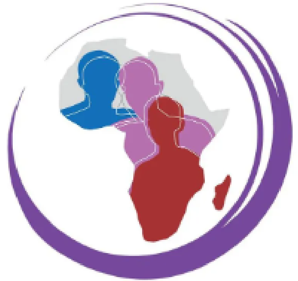
Ilustración 4: Miranj (2025).

Actualmente, en África subsahariana, la mutilación genital femenina continúa siendo una de las expresiones más constantes de esta problemática, logrando afectar a más de 230 millones de mujeres y niñas (UNICEF. (2024, March 8). A pesar de las diferentes leyes, campañas de sensibilización y programas comunitarios apoyados por gobiernos y organismos internacionales como la ONU, millones de niñas siguen estando en riesgo cada año. La continuidad de la práctica está relacionada con la constante presión social, desigualdad de género, pobreza y falta de aplicación efectiva sobre las normas legales. En algunos contextos, se han llegado a documentar exámenes forzados de virginidad y otras prácticas tradicionales que constituyen tratos degradantes y violentos frente a las mujeres.