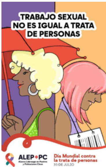
Ilustración 3: ICW Latina. (s. f.).

Finalmente, a finales del siglo XX, las propias trabajadoras sexuales comenzaron a organizarse y a exigir participación en las diferentes políticas que las afectan. Pasaron de ser consideradas únicamente como un grupo de mujeres que debía ser controlado y estigmatizado, a ser reconocidas como personas con derechos y participantes activas en el debate público.