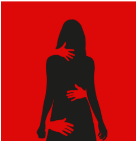
Ilustración 1: Violencia sexual (Plena inclusión España, 2024).

La violencia de género y las prácticas de “purificación sexual” mediante la violencia contra mujeres y niñas han sido reconocidas por la comunidad internacional como una violación grave de los derechos humanos. De acuerdo con la Declaración sobre la Eliminación de la Violencia contra la Mujer de la Asamblea General de las Naciones Unidas, la violencia de género incluye actos de violencia física, sexual y psicológica contra mujeres y niñas en la familia y en la comunidad, y constituye en una violación de sus derechos fundamentales, la igualdad, la seguridad, la libertad y la dignidad humana.