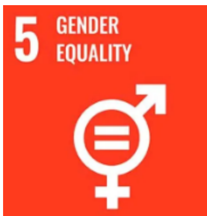
Ilustración 5: UN Sustainable Development Goal 5 - Gender equality - Swansea University. (n.d.).

En América, estas prácticas no suelen presentarse como rituales formales, pero se reflejan en formas de violencia sexual estructuradas dentro de la sociedad, matrimonios infantiles, maternidad forzada en niñas y exámenes de virginidad realizados en ámbitos informales o institucionales. Estas situaciones evidencian que aún persisten normas sociales que asocian el valor de las niñas y adolescentes con su sexualidad y su "honor", lo que limita su autonomía corporal y dificulta su acceso a justicia y protección en la mayoría de los casos.