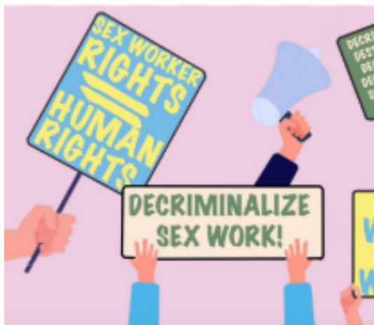
Ilustración 4: Lieberman, H. (2022).

En los últimos años, el avance de las plataformas digitales y el impacto de la pandemia de COVID-19 han transformado significativamente las dinámicas del trabajo sexual a nivel global. El uso de redes sociales y plataformas en línea ha permitido a algunas trabajadoras sexuales reducir su exposición a la violencia callejera y aumentar el control sobre sus condiciones laborales; sin embargo, también ha generado nuevos desafíos, como la vigilancia digital, la censura de contenidos y la exclusión financiera mediante el cierre de cuentas bancarias o plataformas de pago. Estas transformaciones han puesto