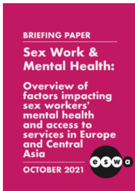
Ilustración 5: riefing Paper on Sex Work and Mental Health (ESW, 2021)

En algunos casos, la falta de apoyo y el temor a buscar ayuda profesional agravan estos problemas. Estudios han demostrado que estas experiencias pueden tener efectos duraderos en el bienestar emocional de las personas afectadas.