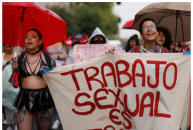
Ilustración 1: Trabajadoras sexuales marchan en CDMX (Forbes México, 2025).

En contraste, otras culturas y períodos históricos condenaron con mayor severidad la Antigua Roma, influenciada principalmente por doctrinas religiosas y normas morales dominantes. Esta evolución histórica evidencia una constante contradicción: el trabajo sexual, aunque en ocasiones reconocido y regulado por las autoridades a lo largo de la historia, estuvo acompañado de estigmatización y exclusión social hacia quienes lo ejercían, reflejando tensiones persistentes entre regulación, moralidad y derechos.