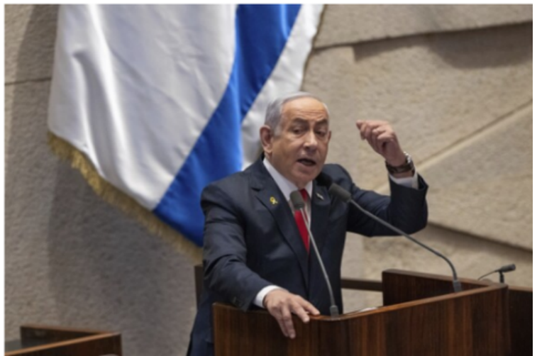
Ilustración 2: Benjamin Netanyahu, primer ministro de Israel, acusado por la Corte Penal Internacional, dirigiéndose a los legisladores del Knéset.

Sin embargo, la CPI ha argumentado que Palestina, al ser parte del Estatuto de Roma, autoriza a la Corte Penal Internacional a juzgar crímenes cometidos en el territorio, por lo que no se necesita aprobación de Israel para que la CPI investigue y juzgue crímenes de guerra cometidos en territorio palestino, incluso si los acusados son de países que no son miembros de la Corte. Esto se basa en el principio de jurisdicción territorial, por el cual la CPI puede juzgar crímenes que ocurren en el territorio de países miembros, incluso cuando el acusado es de otro país.