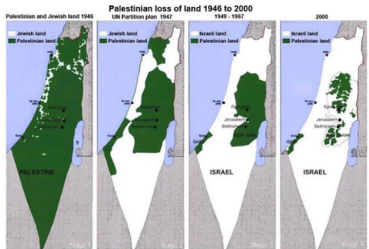
Ilustración 1: Palestinian loss of land 1945 to 2000 (The Economist, 2010).

cual fue aceptado por los representantes judíos, mas fue rechazado por la mayoría de los Estados árabes. Esto llevó a la Guerra Árabe-Israelí de 1948, tras la declaración de independencia de Israel en el mismo año. Esta guerra tuvo varias consecuencias para la geopolítica local; las más vitales fueron la expansión de Israel, el desplazamiento de alrededor de 700,000 palestinos (Nakba) y el control de Jordania sobre Cisjordania, y de Egipto sobre la franja de Gaza.