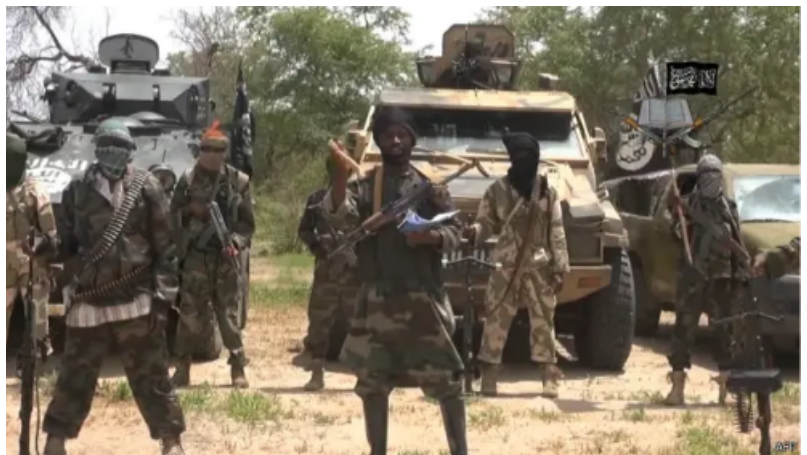
Ilustración 2: Boko Haram juró lealtad al califa Ibrahim, Abubaker al Bagdadi, el líder de Estado Islámico (BBC, 2015).

Durante su presidencia, los ataques contra cristianos incrementaron, pero raramente el gobierno intervenía, y los sospechosos casi nunca eran arrestados.