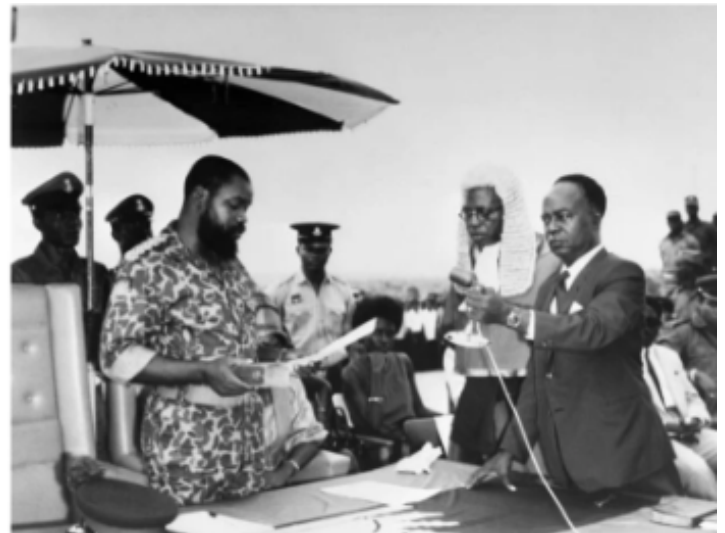
Ilustración 1: El coronel Ojukwu (izquierda) declara la independencia de Biafra en un discurso radiado (La Provincia, 2017).

Nigeria obtuvo su independencia del Reino Unido en 1960, y en 1966, ocurrió el primer golpe de Estado liderado por oficiales igbo, quienes afirmaban querer poner fin a la corrupción y la inestabilidad política; sin embargo, en el norte, este golpe fue percibido como un intento de dominación étnica. Tiempo después, se produjo un contra golpe de Estado, encabezado por oficiales del norte, lo que desató mucha violencia contra la población igbo que vivía en la región. Miles de personas fueron asesinadas y otros huyeron buscando protección; no obstante, ante la falta de seguridad y el sentimiento de abandono por parte del gobierno, el líder de la región oriental,