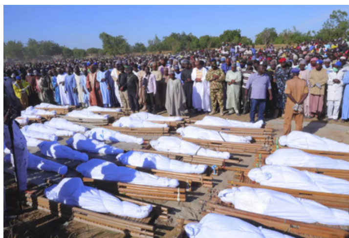
Ilustración 3: Personas asisten a un funeral por los asesinados por presuntos militantes de Boko Haram en Zaabarmar, Nigeria.

La situación actual dentro de Nigeria se puede definir como un ciclo de violencia, la cual está escalando cada vez más y más, y ha hecho que Nigeria sea uno de los lugares más peligrosos en el mundo para los cristianos. Según "Open Doors", un grupo estadounidense, el cual se enfoca en identificar y anotar la persecución cristiana, "el 82% de los cristianos asesinados en todo el mundo entre octubre de 2022 y septiembre de 2023 encontraron la muerte en Nigeria". La persecución no se limita solo a los asesinatos en masa y la persecución de líderes religiosos e instituciones, sino que desde el inicio de