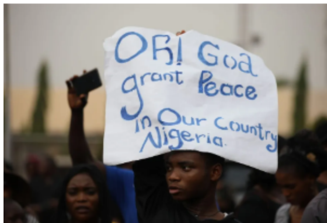
Ilustración 5: Pueblo nigeriano protestando por la seguridad de los cristianos (Foreign Policy, 2020).

Incluso frente a la persecución de los cristianos en Nigeria, y lo que ha sido denominado por muchos cristianos como un “genocidio cristiano”, la comunidad internacional no ha afirmado que este sea el caso, y el gobierno nigeriano afirma que esta violencia no es discriminatoria, sino que es una consecuencia de la inseguridad generalizada dentro del país, y también la competencia por recursos. El gobierno también afirma que, debido a que grupos tales como los musulmanes también son víctimas frecuentes de los mismos grupos insurgentes, por ejemplo, en febrero de 2026, más de 160 musulmanes fueron masacrados en la provincia de