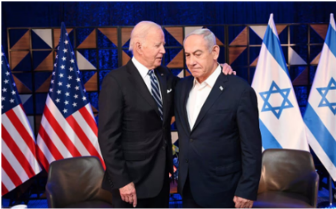
Ilustración 3: El presidente estadounidense, Joe Biden; en un encuentro con Benjamin Netanyahu (Infobae, 2024).

En contraste, otros países han manifestado rechazo y dado críticas a la decisión de la CPI. Estados Unidos ha cuestionado la autoridad de la Corte y ha respaldado a Israel; también algunos países como Hungría han mostrado oposición a la decisión de la Corte. Esta división pone en evidencia las tensiones políticas y la controversia que rodean el caso.