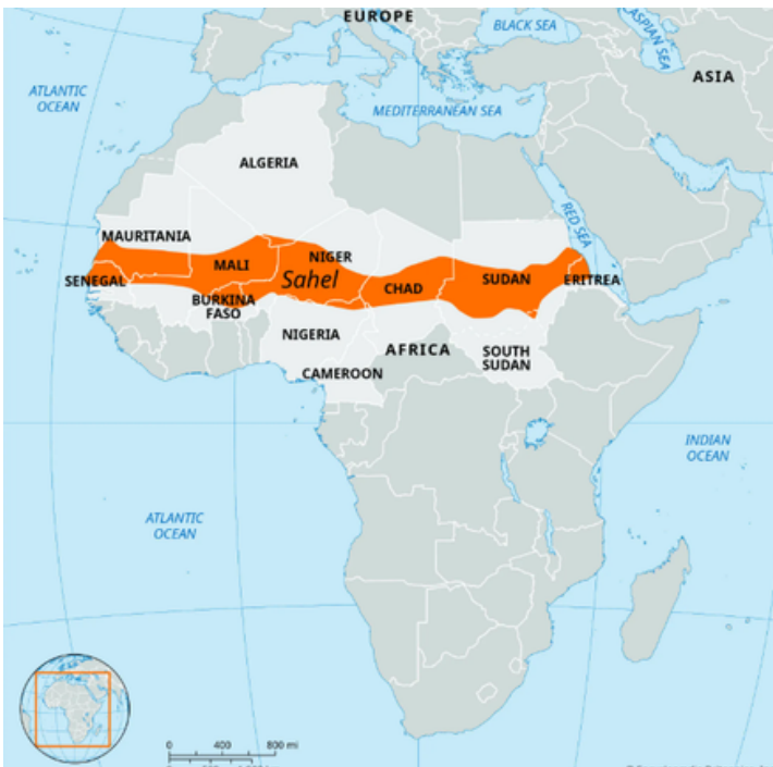
Ilustración 1: Mapa del Sahel (Britannica, s.f.).

El Sahel es una región africana que hace una franja entre el norte y el sur de África, separando el desierto de las zonas tropicales y las sábanas.